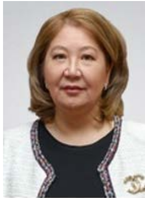
Тлевлесова Сауле Январбековна Президент Евразийского патентного ведомства (ЕАПВ) Евразийской патентной организации (ЕАПО)