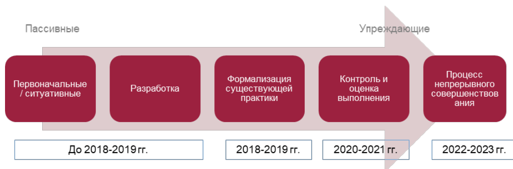
Рис. 3: Сроки выполнения дорожной карты ВОИС «Борьба с мошенничеством»