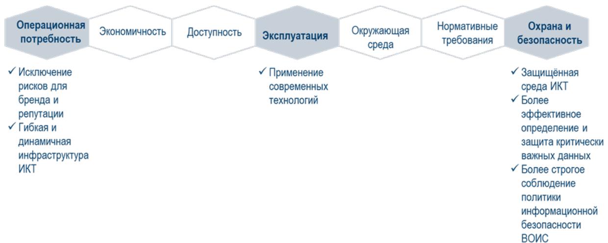
Диаграмма 1. Основные критерии отбора гибридного этапа проекта ОЗП РСТ